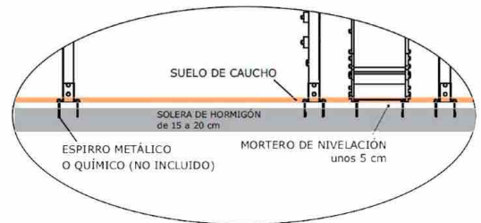
INSTALACIÓN EN SUELO DE HORMIGÓN